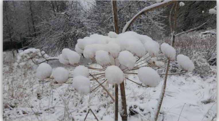
Žiemos lengvumas.