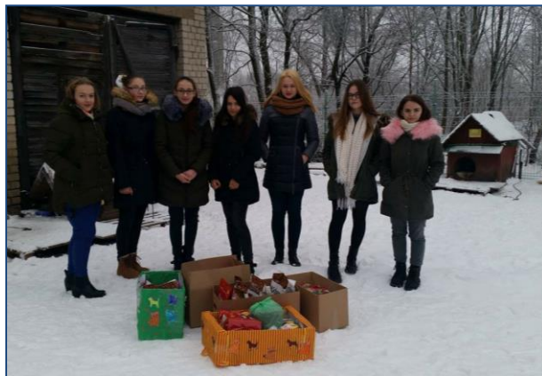
Išvykos į „Klajūną“ akimirka